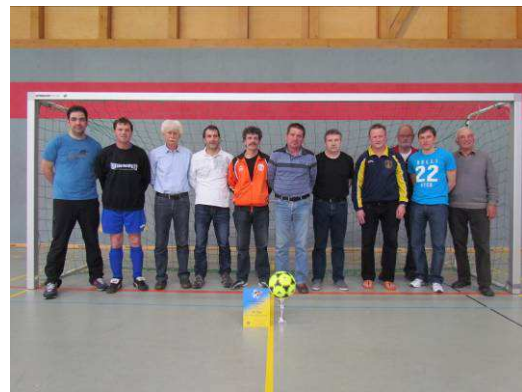
Sieger, die Traditionsmannschaft