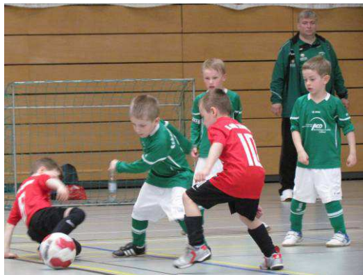
Die Bambini im Kampf um den Ball