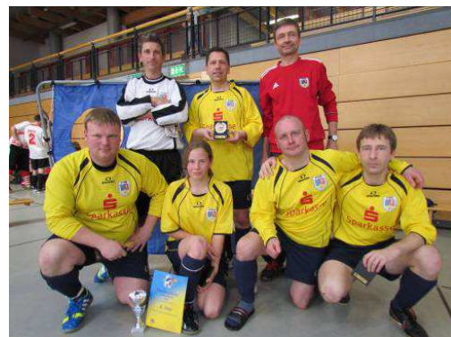
Die Funktionärsmannschaft des FVO