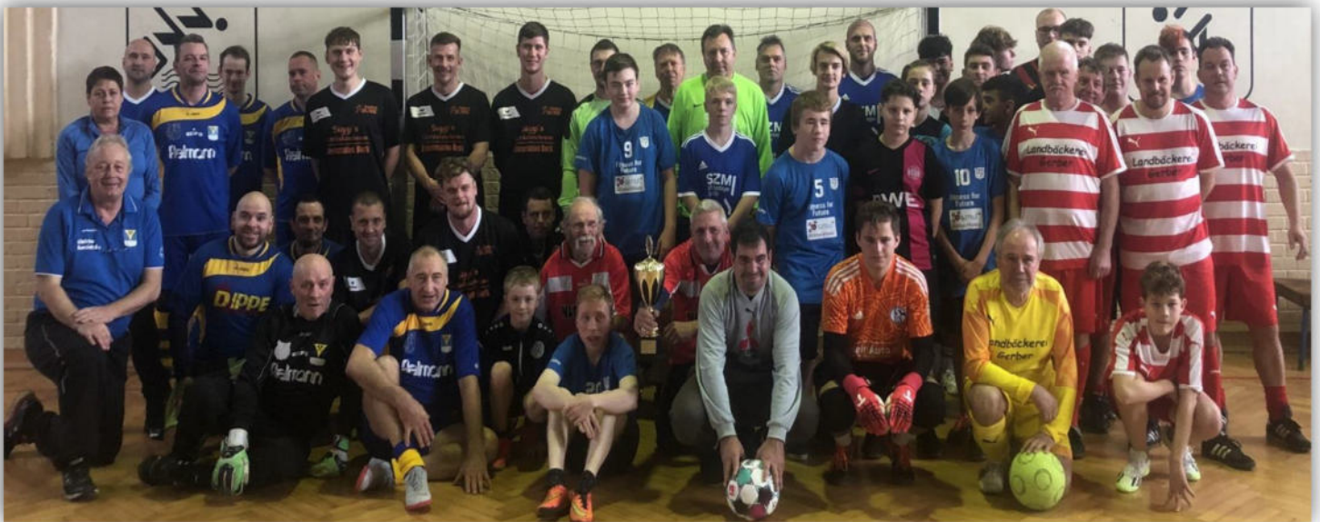
Die Teilnehmer des Freizeit-Cups