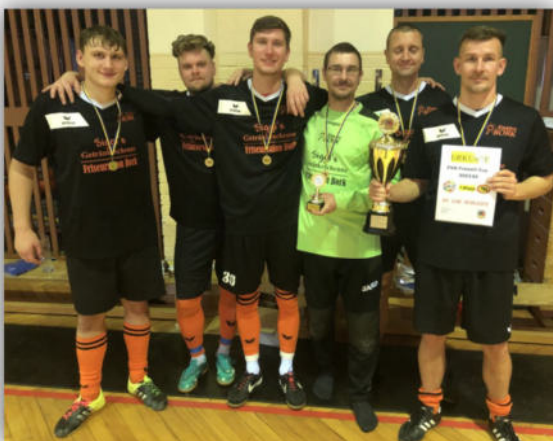
Der FVO-Freizeit-Cup-Sieger 2023/24 - SV Lok Schleife