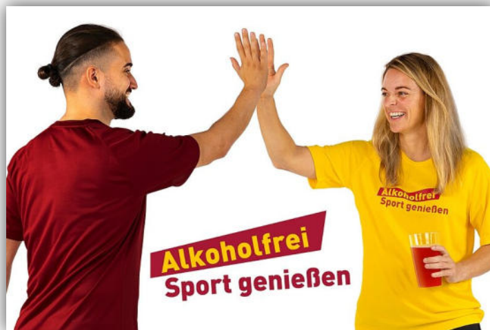
Nia Künzer, Fußball-Weltmeisterin von 2003, engagiert sich von Beginn an als Botschafterin für „Alkoholfrei Sport genießen“.

Von Bundeszentrale für gesundheitliche Aufklärung (BZgA) & SFV